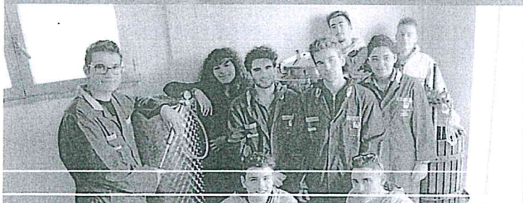
Agraria, Agroalimentare e Agroindustria