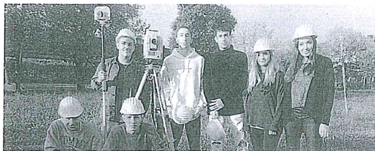
Costruzioni, Ambiente e Territorio